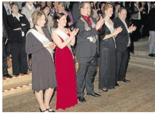
Festlich zu ging es beim Winterball 2012.