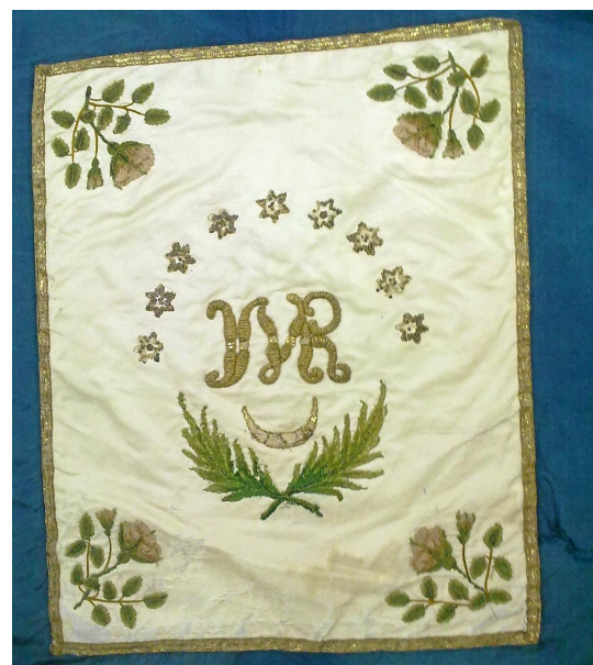
Die Fahne soll dieses Jahr restauriert werden.

Heute feiern die Schützen nicht mehr auf den Tag genau, sondern immer an einem Samstag. Egal wann gefeiert wird, ein schönes Fest wird es auf jeden Fall: Wie aus der alten Chronik des Schützenvereins hervorgeht, war dieser Tag mit dem geselligen Beisammensein ein besonders großer und schöner Festtag.